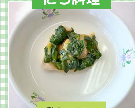
鶏肉のソテー にらソースがけ