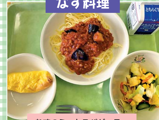
なすのミートスパゲッティ