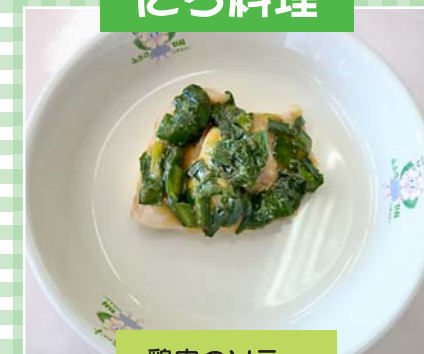
鶏肉のソテー にらソースがけ