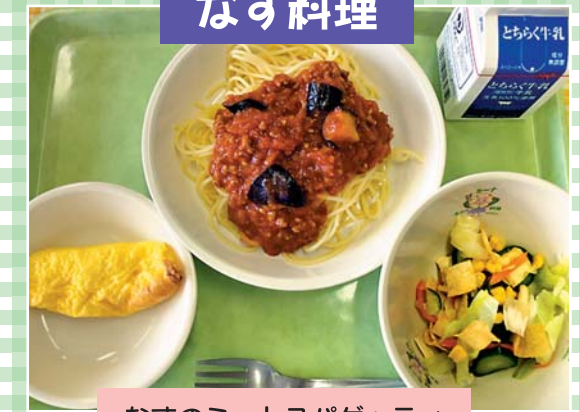
なすのミートスパゲッティ