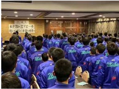
誓いを立てた立志式

2日間、礼儀正しく規律ある行動をとり、一回り成長して帰校することができました。保護者の皆様には送迎等、大変お世話になりました。