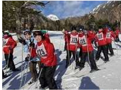
スキーもみるみる上達