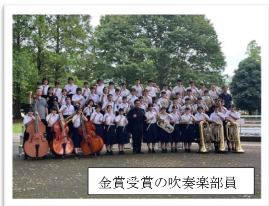
金賞受賞の吹奏楽部員