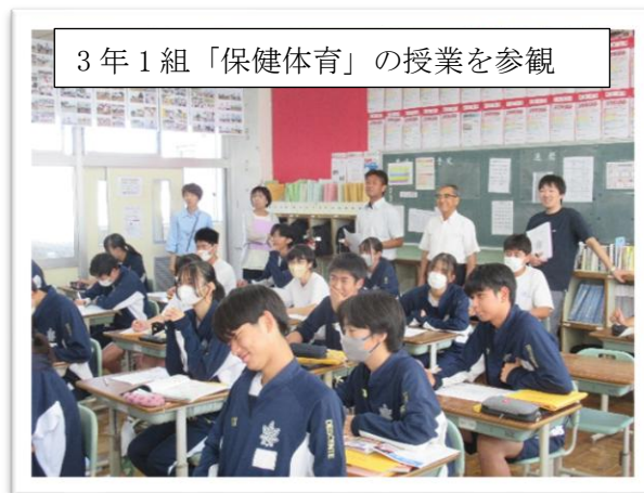
3年1組「保健体育」の授業を参観

発である。先生方が生徒主体の授業を実践している。授業が楽しそう。同じ内容の学習でも、教師の教え方に工夫があり、ICTやプリント学習の導入、一斉学習や個別学習など様々なアプローチが見られた。先生方が生徒目線で対応している」など、本校生徒の長所をたくさん見ていただきました。