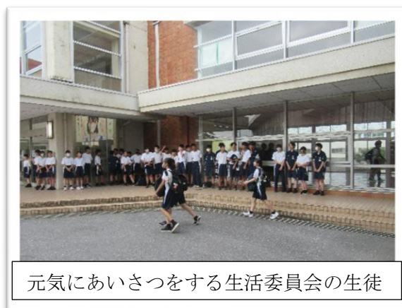
元気にあいさつをする生活委員会の生徒

9月17日(水)早朝、昇降口前や正門前、北門前、自転車置き場周辺から爽やかな明るい挨拶が聞こえてきました。生徒会が企画した「犬中あいさつの日プロジェクト」です。「あいさつの意識を高め、あいさつが溢れる南犬飼中学校にすることで、活気のある校風を創り上げていく」、「生徒自らあいさつ運動に参加することで、物事に主体性をもって取り組む力を養う」ことを目的に、生徒会が主体となって企画しました。今回のあいさつプロジェクトの特徴は、大きく2つあります。1つ目は、あいさつ週間として集中的にやるのではなく、年間を通して月に2回ずつ実施すること。2つ目は、部活動ごとの活動ではなく、各委員会での活動にして生徒全員が参加できるようにしたことです。1回目の今回は、生活委員会の生徒が主体となって活動しました。朝から生き生きとした声が響き渡り、とても気持ちよく1日のスタートがきれたように感じました。