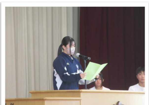
2学期始業式 3年生代表による2学期の抱負

9月1日(月)、2学期が始まりました。2学期は、1年の中で1番長い学期であるだけでなく、夏の暑さから、秋の涼しさ、冬の寒さを体感できる非常に過ごしやすい学期であることは言うまでもありません。2学期は、大きな行事である輝光祭、部活動の新人戦、定期テスト等多くの行事がたくさんあり、生徒にとって1年で最も充実した日々を送ることになると思います。そこで、始業式では、「自分で考える」ということをテーマに話をしました。「自分」という言葉をキーワードに、様々な部門で目標を立てるということです。「自分でテーマや目標を見つける」「自分なりの方法で挑戦する」「自分で夢を見つける」という意味での「自分」です。「自分で考えることの大切さ」をぜひ実践してほしいと思います。