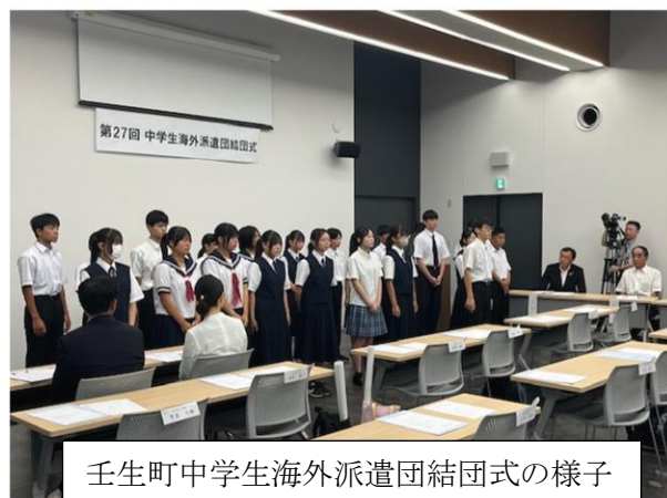
壬生町中学生海外派遣団結団式の様子

7月29日(火)、第27回壬生町中学生海外派遣団結団式が行われ、8月2日(土)～10日(日)までの9日間、壬生町の中学生20名がオーストラリア・シドニーに語学研修に参加しました。本校の生徒は2年生8名、3年生3名の計11名が参加しました。普段学習している英語のコミュニケーション能力を十分に発揮し、外国の文化や伝統をたくさん学べた貴重な体験となりました。