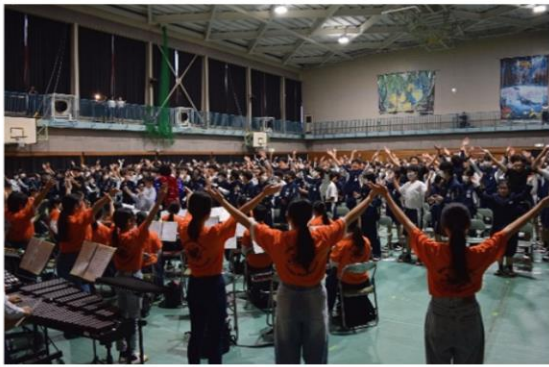
「吹奏楽部の演奏で会場は大盛り上がり!!」

10月25、26日の2日間にわたり、本校の2大行事である輝光祭が盛大に開催されました。今年のスローガンは「イロトリドリ～見出す真価、絆の深化～」です。輝光祭第1日目は、「オープニング、和太鼓、少年の主張、中学生平和研修派遣事業発表、英語スピーチ、オーストラリア派遣事業、吹奏楽部演奏」、第2日目は、「セカンドオープニング、ダンス、SDG'sファッションショー、犬飼新喜劇、演劇、学校公開、エンディング」と盛沢山の内容でした。生徒達の個性溢れる「色とりどり」の輝く姿がたくさん見られ、各イベントは大盛況でした。学校祭という文化的価値を求める側面と、お祭りの価値を求める側面の両方が噛み合わされた素晴らしい発表内容でした。生徒たちは、準備期間も短く、限られた中での練習しかできませんでしたが、例年にも増してクオリティーの高い発表内容で、観に来た多くの観客を魅了するなど、その活躍に感心させられました。スローガンにある「イロトリドリ」で、進化を見出し、仲間との絆を深化させた素晴らしい生徒に感謝の気持ちでいっぱいです。