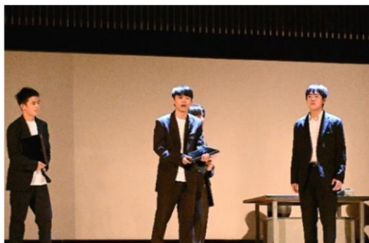
熱演「演劇：時間銀行」